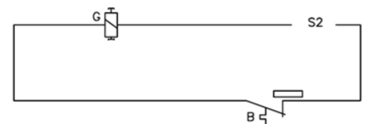
Circuit de protecție împotriva stingerii flăcărilor.

B- termostat; G- electrovalvă integrată în circuitul de protecție împotriva lipsei de flacără; M- motorul ventilatorului; Q- întrerupător; Q2- aprindere; S- ac de aprindere, S2- termocuplu; Y- electrovalvă; C-condensator